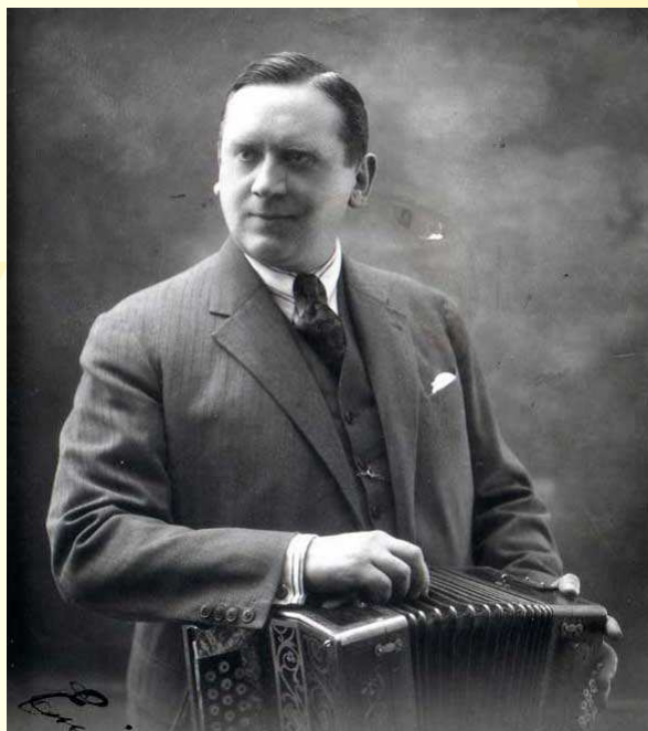
ÉMILE VACHER, "créateur du genre musette"

Dans le quartier de la Bastille qu'ont depuis longtemps investi les Auvergnats, il va jusqu'à s'associer, aux mains d'immigrés italiens, à la cornemuse qui anime les bals de famille des Bougnats, les premiers "Bals Musette". Alors qu'Émile Vacher, rapidement sacré roi de l'accordéon et virtuose du diatonique, donne au "genre musette" son style et ses codes, l'accordéon s'émancipe peu à peu des bals auvergnats. Il s'accompagne d'un violon, d'un saxo ou d'un sifflet à coulisse ( ou "jazzoflûte" !) tandis que le piano assure une cadence inébranlable. Influence américaine oblige, il est remplacé ou complété par le banjo et le "jâze", ancêtre rustique de la batterie (qui donne son nom à la fois à l'instrument, au groupe auquel il appartient, et au style de musique! )